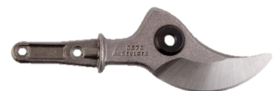
LAME FORGÉE POUR SÉCATEUR