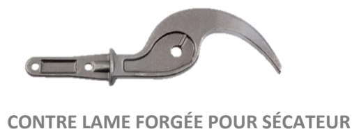
CONTRE LAME FORGÉE POUR SÉCATEUR