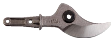
LAME FORGÉE POUR SÉCATEUR