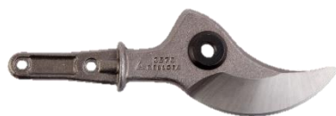
LAME FORGÉE POUR SÉCATEUR