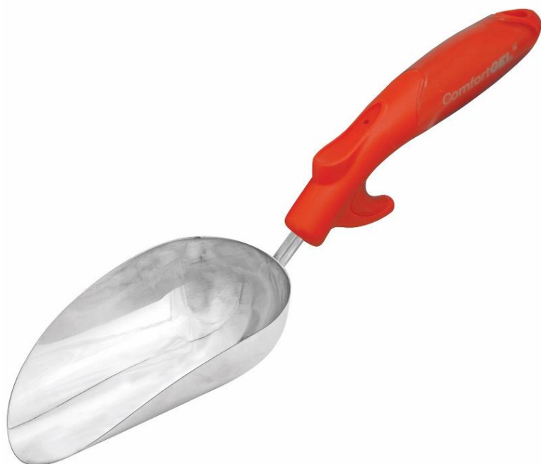
Pelle à terreau grande capacité

Manches avec revêtement gel agréable dotés de cale-pouces antidérapants et d'emplacements pour les doigts, offrant encore plus de confort aux jardiniers en quête d'une expérience agréable et reposante. Outils légers d'une seule pièce dotés d'une tête en alliage d'acier inoxydable anti-déformation, anti-cassure et anti-rouille.